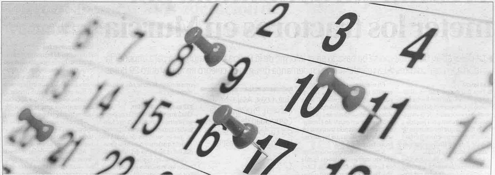
Las agendas de los políticos serán más públicas que nunca e informarán asimismo de las reuniones más importantes que mantengan en sus despachos. L. O.

El registro de lobbies ya se aplica a escala nacional, según confirmó el secretario general de Transparencia y Buen Gobierno, Enrique Ujaldón. En otras comunidades autónomas como Cataluña, el registro era voluntario y no funcionó, por eso la intención de hacerlo obligatorio.